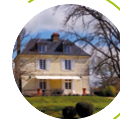
Vautourneux Manoir construit au XIX ème siècle

Situé au centre de l'agglomération, ce prieuré, autrefois occupé par les moines qui ont défriché la forêt de Gâtines alentour, est élevé sur des caves datant du XII ème siècle. Probablement bâti en même temps que l'église, qui se dresse à proximité, il dépend de l'abbaye de la Trinité de Vendôme. En partie restauré, il conserve de beaux vestiges du XVI ème siècle sur son pignon nord.