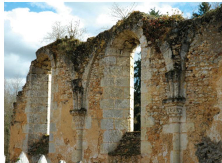
Abbaye de Gâtines

Villedômer se situe à l'angle de deux jolies vallées : la Brenne et le Madelon. C'est également une commune très boisée et pourvue d'un grand nombre de châteaux et de moulins que vous pourrez admirer le long des trois circuits pédestres qui vous sont proposés : du Madelon à l'Archevêque, le chemin du Buisson de la Dame, ainsi que le chemin du pic vert et du hérisson à découvrir en famille.